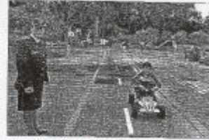
En varios sectores de la provincia se realizan simulacros sobre educación vial.

Concurso de posters con los alumnos de los cursos de diversificación de los colegios del sector.