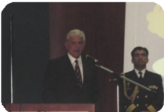
Dr. Alfredo Palacio, Vicepresidente de la República