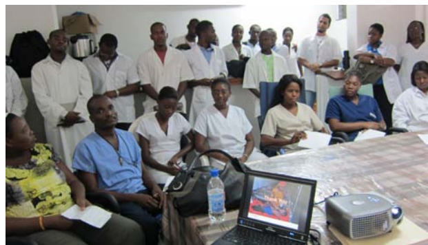
Des agents de santé haïtiens participent à Port-au-Prince à la formation sur le choléra

À Port-au-Prince, les nombres cumulés d'admissions hospitalières et de décès étaient respectivement de 953 et 46, pour la même période. Dans la zone métropolitaine, des cas de choléra ont été confirmés dans six des sept communes.