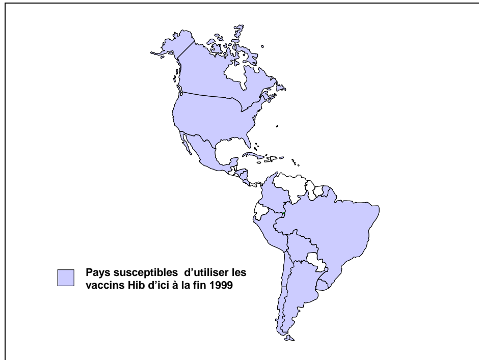
Figure 3. Utilisation du vaccin Hib dans les Amériques pour 1999

Des facteurs décisifs sous-tendant l'introduction du vaccin anti-Hib dans plusieurs pays comprennent entre autres une sensibilisation plus aiguë aux maladies de la méningite parmi les parents concernés, la connaissance par la profession médicale et les ministres de la santé de plusieurs essais cliniques soulignant la sûreté, l'efficacité et l'effectivité du vaccin, et l'expérience précédente avec le vaccin dans le secteur privé. Un autre facteur essentiel consiste à avoir un système de surveillance bien structuré qui donne à l'avance l'information épidémiologique pertinente sur la maladie. Les pays qui remplissent ces conditions sont en mesure d'analyser rapidement l'efficacité du vaccin anti-Hib par rapport à son coût et d'obtenir l'engagement des autorités publiques de financer le vaccin sur une base systématique.