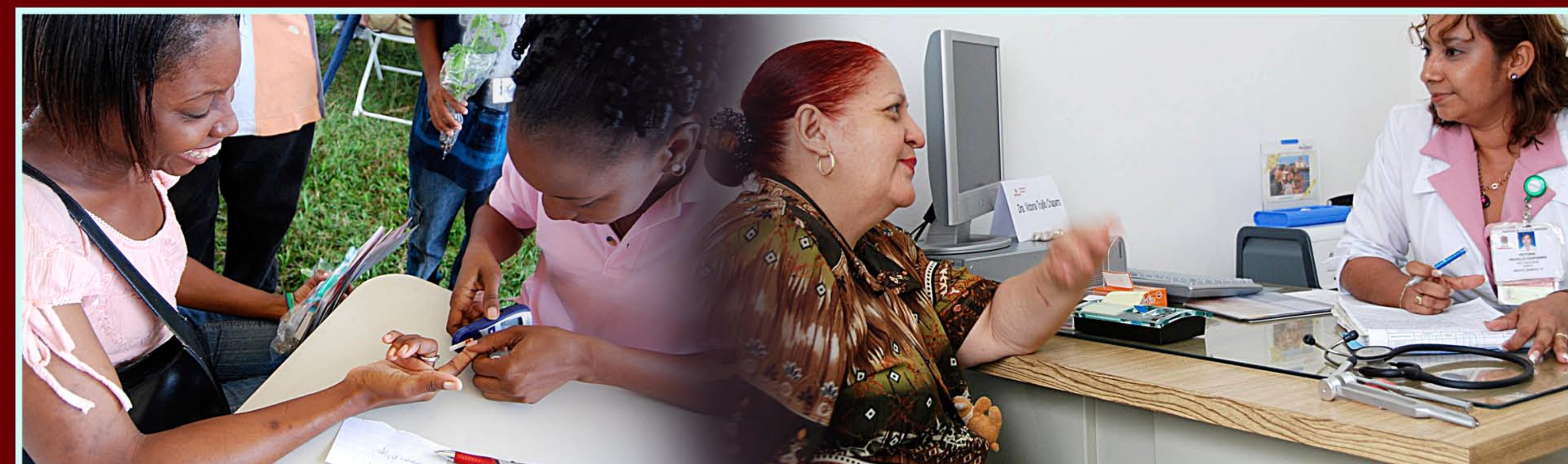
KNOW YOUR RISK • CONOZCA SUS FACTORES DE RIESGO