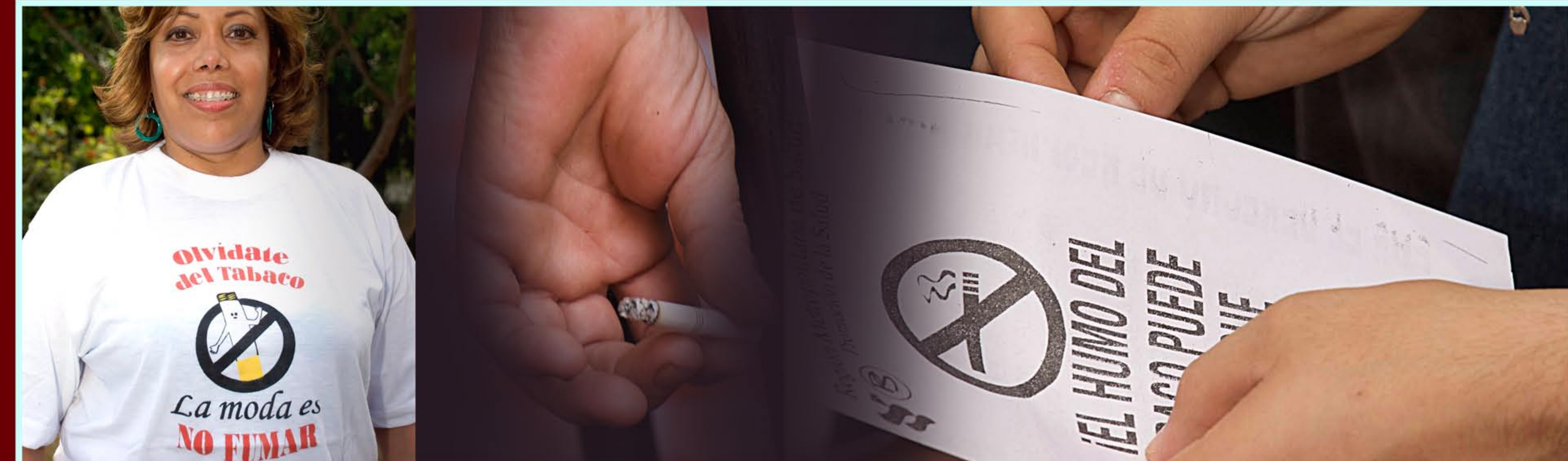
LIVE SMOKE-FREE OR SAY NO TO TOBACCO • VIVE LIBRE DE TABACO O DILE NO AL TABACO