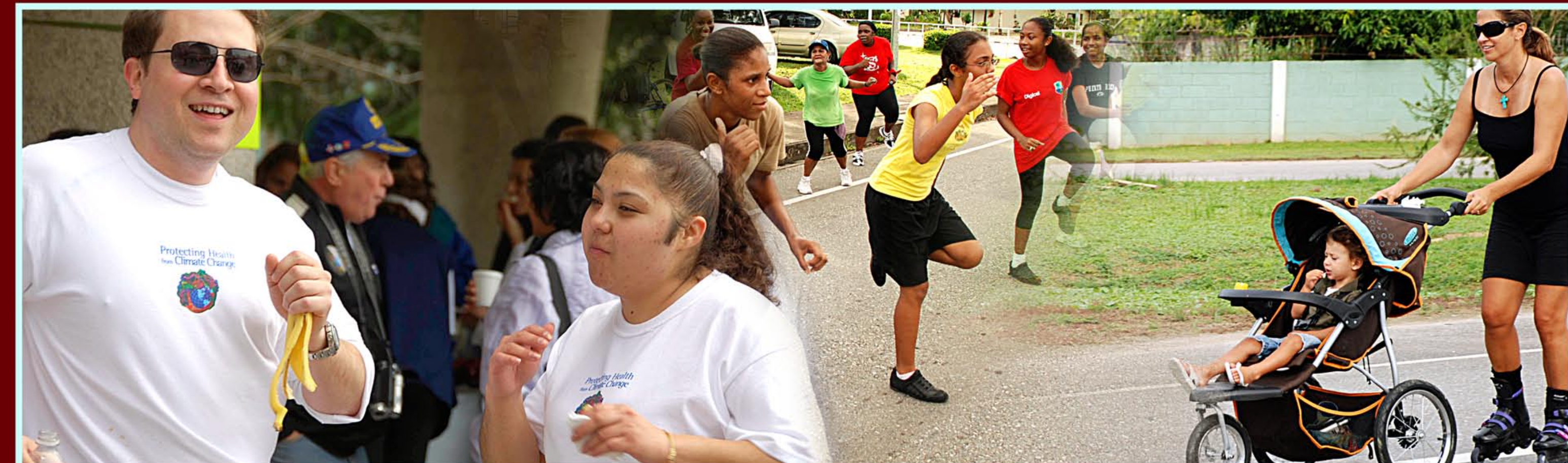
TAKE ACTIVE BREAKS • TOMA PAUSAS ACTIVAS