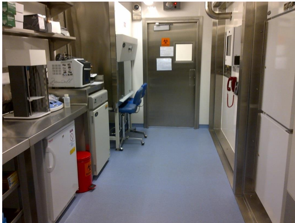
Concepto BSL-3 Modular, CARPHA, Trinidad & Tobago.