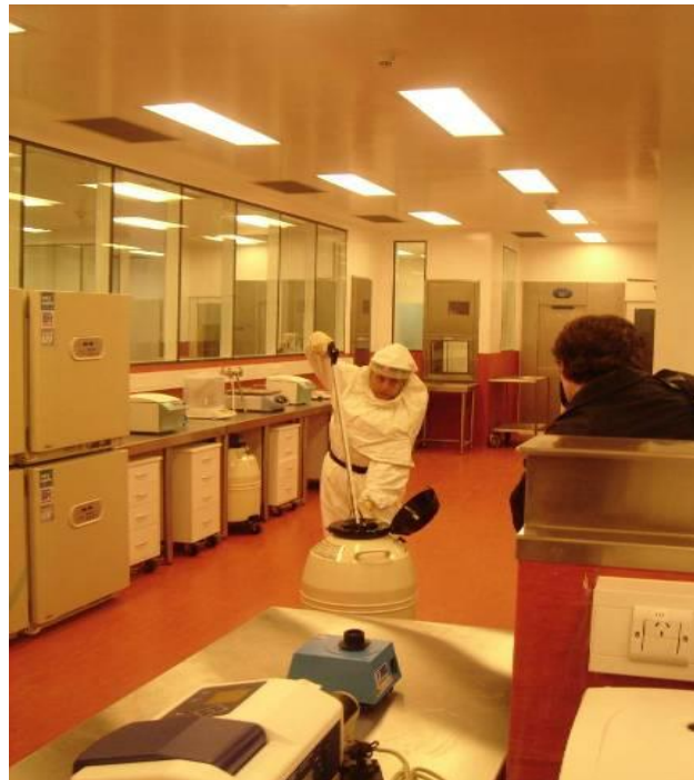
BSL-3, ANLIS C. Malbrand, Argentina.