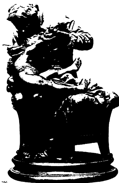
Edward Jenner inoculado a su hijo contra la viruela

El descubrimiento del Dr. Jenner fue el primer intento científico de combatir una enfermedad infecciosa por medio de una vacuna, y se dice que sentó las bases de la vacunología moderna. Ochenta y siete años después, el Dr. Louis Pasteur descubrió la vacuna contra la rabia, y en los años cincuenta los Dres. Albert Sabin y Jonas Salk descubrieron la vacuna antipoliomielítica. Sus importantes contribuciones científicas se conmemorarán en todo el mundo en el ámbito de la salud pública durante 1996, Año de la Vacuna .