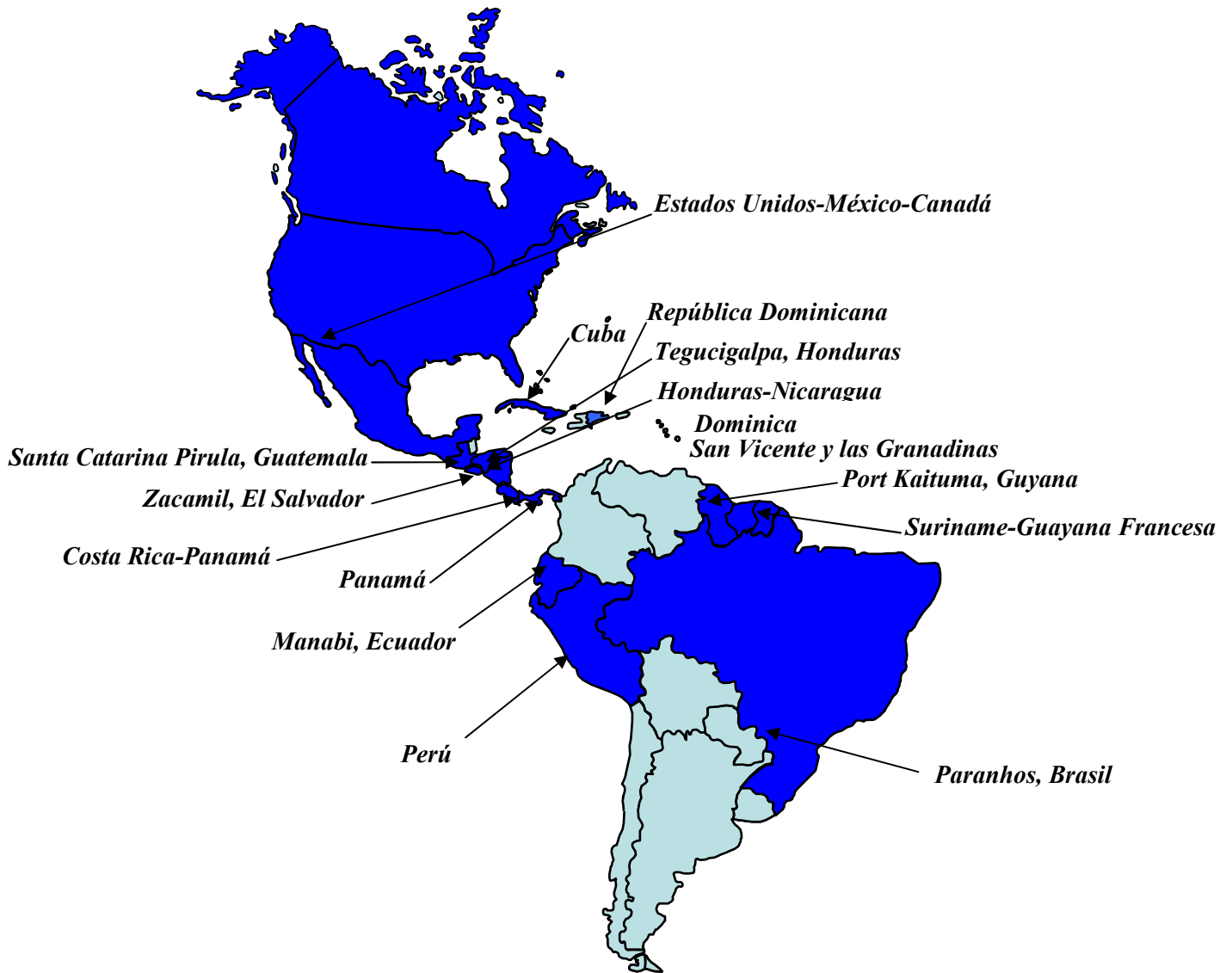
Figura 1. Eventos Nacionales, Binacionales y Tri-nacionales: SVA 2006