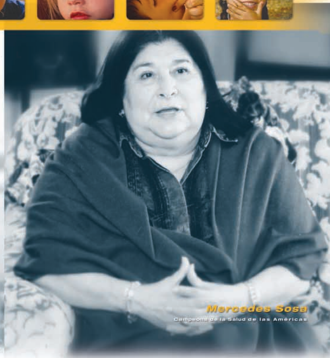
Mercedes Sosa Campeón de la Salud de las Américas

"...Llevar a nuestros hijos a vacunar es la mejor manera de asegurarles el derecho que tienen de crecer sanos y felices, permíteles que ellos te agradezcan con una sonrisa..."