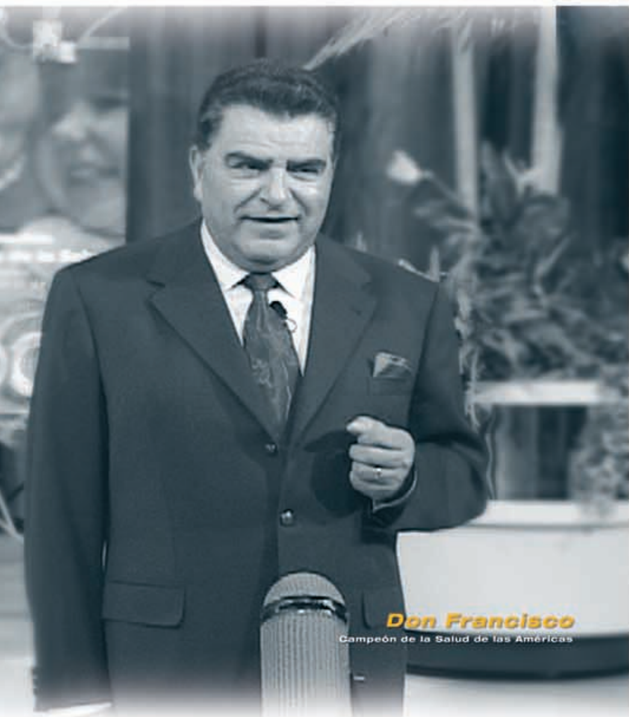
Don Francisco Campeón de la Salud de las Américas

"Lleve su niño a vacunar. De usted depende que su niño tenga todas las vacunas al día. De usted depende su felicidad y todo lo que ellos pueden llegar a ser."