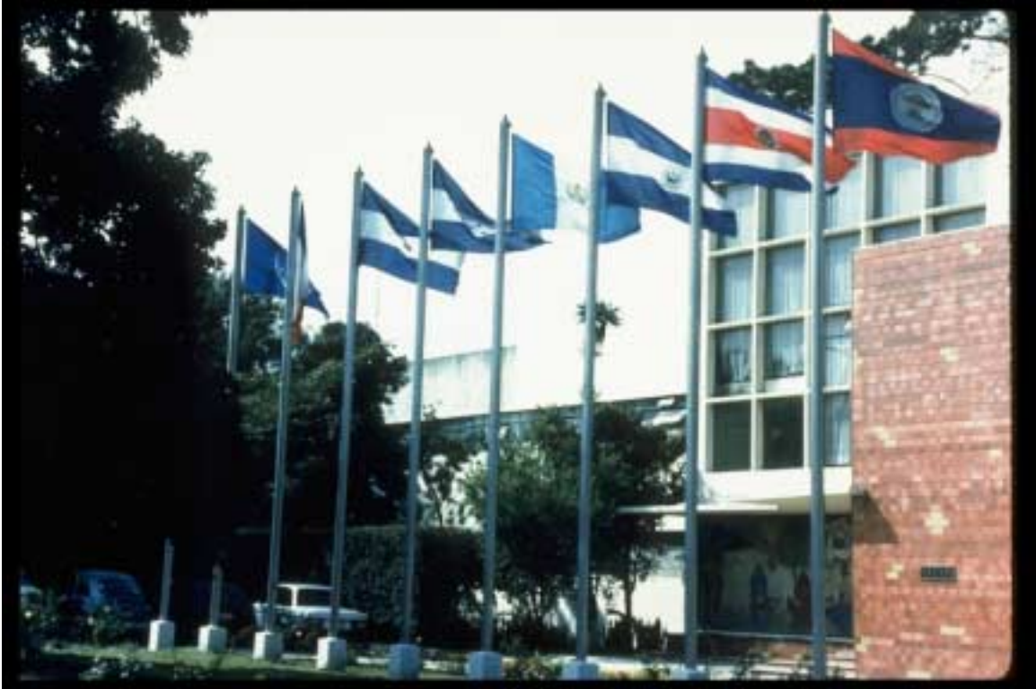
INSTITUTO DE NUTRICIÓN DE CENTRO AMÉRICA Y PANAMÁ